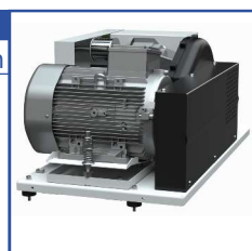
Tête de compression